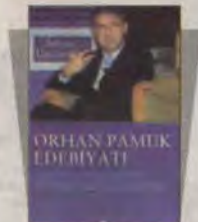
Orhan Pamuk Edebiyatı Sabancı Üniversitesi Sempozyum Tutanaqları Agora Kitaplığı 179 sayfa