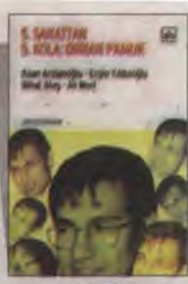
5. Sanattan 5. Kola: Orhan Pamuk Kaan Arslanoğlu, Ergin Yıldızoğlu, Ali Mert ve Nihat Ateş İtahi Yayınları 157 sayfa

■ Bir yanda uluslararası alanda kültürel çevreleri nezdinde itibarlı bir yer edindi Orhan Pamuk. Diğer yanda yaptığı açıklamalar nedeniyle, çok sert eleştirilere maruz kaldı, "Türklüğü ale-